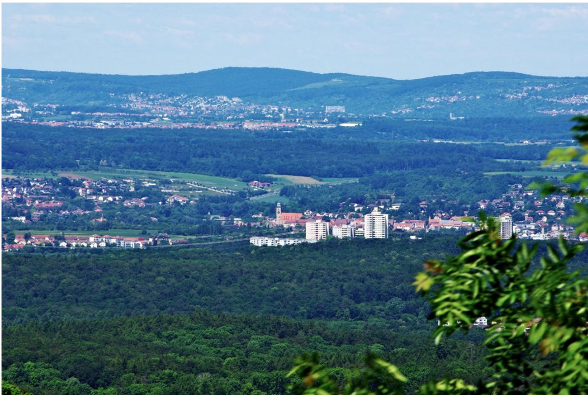
Gleiche Blickrichtung, nur mit etwas längerer Objektiv-Brennweite. In Bildmitte der Nürtinger Stadteil Roßdorf, dahinter die Nürtinger Stadtkirche.