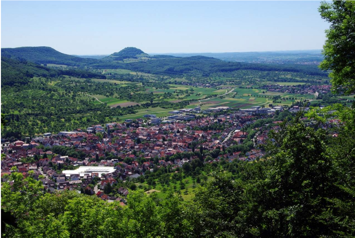
Blick in die andere Richtung hinunter nach Dettingen. Hinten halblinks ist die Achalm zu sehen, der Reutlinger Hausberg.