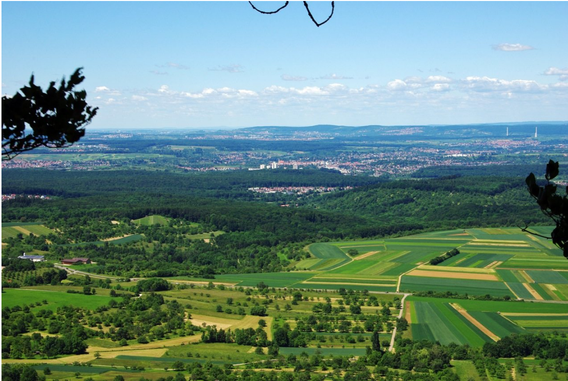
Blick vom Hörnle in Richtung Nürtingen. Rechts hinten die beiden Schornsteine des Kraftwerkes Altbach-Deizisau.